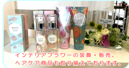
インテリアフラワーの装飾・販売、ヘアケア商品も取り揃えてあります。

この春からは新しくメニューにボタニカルカラーが登場します。「気分を変えたい、流行を取り入れたい、まとも・艶が欲しい」等の要望にも応えたメニューになり、髪の毛をいかに美しく健康に見せるかに重点を置いていく感度の高いオーナーが自信を持って提案できるものになっています。