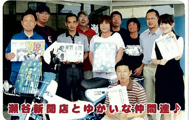
瀬谷新聞店とゆがいな仲間達♪