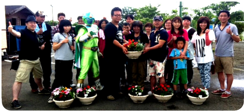
この日は約30鉢の花植え作業をしました♪

6月16日(日)、鹿沼市下奈良部町にある「社会福祉法人仁篤会 児童養護施設ネバーランド」にて、「Line(ライン)かぬま」有志約20名と、施設児童約40名と共に花植えのイベントが行われました。