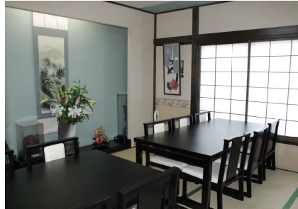
落ち着いた雰囲気の中、ゆっくりと料理を味わう贅沢なひと時。美味しい料理に会話も弾むことでしょう。

【住】鹿沼市戸張町2487 【☎】0289 - 62 - 3836 【営】 昼 11:30~14:00 (LO 13:30) 夜 17:00~21:00 (LO 20:30) 【休】火曜日