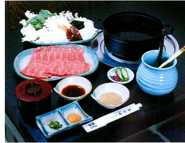
「あさや しゃぶしゃぶセット」2,500円。※2人前より承ります。和牛ロースが口の中ですとろけます。