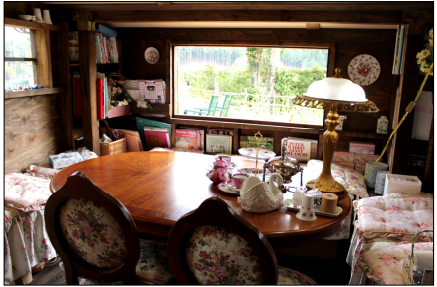
とっても可愛い教室♪ 小窓からは素敵なお庭と木々が見えます。楽しいひと時を…♪