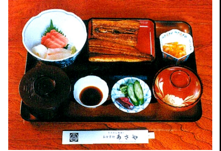
「うなぎ御膳」3,800円。お客様へ新鮮なうなぎを提供する為、事前にご予約をお願いします。