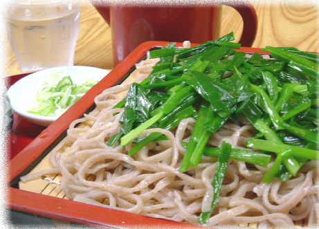
鹿沼の名物 にらそば(600円)

安全を考えて地産地消を推進しています。そば粉・米・舞茸・野菜など国産の物を使用し、ベテラン調理人がプロの技で調理しています。 「味」「価格」「量」いずれも満足でき、子供から大人まで安心して食べられる佐野屋の蕎麦。皆さまも是非ご賞味ください♪