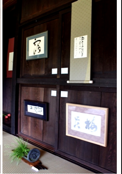
② 『遊』宏房ギャラリーにて趣ある書が並んでいます