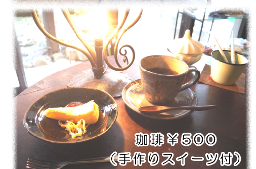
珈琲 ¥500 (手作りスイーツ付)