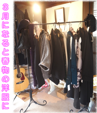
3月になると春物の洋服に 出会えますよ！

【問】鹿沼商工会議所振興課 TEL.65-1111 (担当) 大橋 モード設計事務所 鹿沼市貝島町611-4 TEL.65-0422 / FAX.62-8803