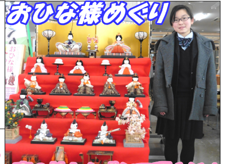
おひな様めぐり 春の訪れを感じて下さい

毎月 20 日 発行 （株）瀬谷新聞店 せやTOWN編集室 〒322-0021 鹿沼市上野町122-1 TEL: 60-2855 FAX: 64-7255 URL: http://www.seyashinbun.com/