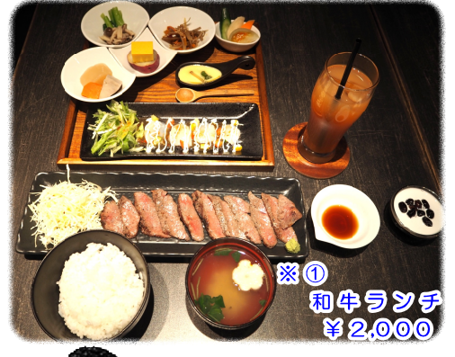
※① 和牛ランチ ¥2,000

蔵の街 栃木市にある蔵 chicくらしくは今年4月でオープン1周年を迎えます。蔵の中にあるシックな空間でランチ&ディナーがゆっくりと味わえる、隠れ家のようなレストランです。ランチメニューは、握り寿司やパスタ、ハンバーグなど和洋折衷料理全7種類の中から選べる。炭火で焼き上げた鹿沼牛をワサビとポン酢でさっぱりと味わえる『和牛ランチ』(写真)が特にオススメです。どのランチにも一品一品手の込んだ前菜7種とドリンク・デザートが付いてきます。