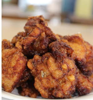
何個でもいける醤油♪