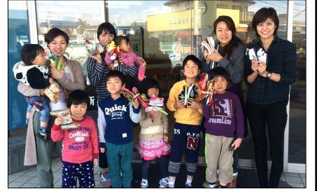
「世界の子供達に靴を贈ろう！」 子育て支援クラブ『レインボー』の 皆さんが靴を贈呈してくれました！

毎月20日発行 (株)瀬谷新聞店 せやTOWN編集室 〒322-0021 鹿沼市上野町122-1 TEL: 60-2855 FAX: 64-7255 URL: http://www.seyashinbun.com/ コラム・新聞記事の感想 俳句・川柳の投稿は左記まで ※ペンネーム可