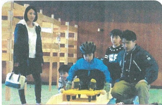
☆わくわく☆どきどき☆木スレーを楽しむ子ども達

TEL : 60-2855 FAX : 64-7255 URL : http://www.seyashinbun.com/