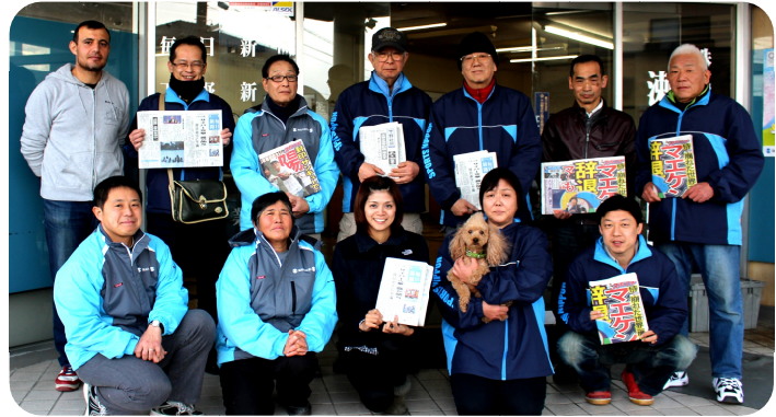
今年で7年目のCCVまつり