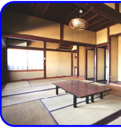
右) ゆったりとしたフロント&リビング

【営】予約制【休】不定休【住】鹿沼市天神町1704【E】info@cicacu.jp【HP】www.cicacu.jp Facebook あります!