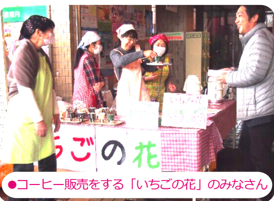
●コーヒー販売をする「いちごの花」のみなさん

今を生きる私たちは「行政に頼るのではなく、行政から頼られるように、将来的な危機感を持ち、気づく人、解決できる人、動ける人、目的や課題に応じたグループやネットワークを数多く作り、対価の為に動く事、今後の社会生活において必要不可欠になっている」という事を会場にいるすべてのみなさんと共有していました。また、特設会場では認知症カフェ「いちごの花」のみなさんによるコーヒー販売も行われました。