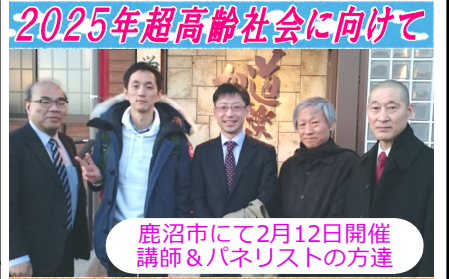
2025年超高齢社会に向けて 鹿沼市にて2月12日開催 講師&パネリストの方達 ～福祉の社会化を考えるフォーラム～