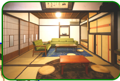
左) 18畳の松竹梅の間(レンタルスペース)