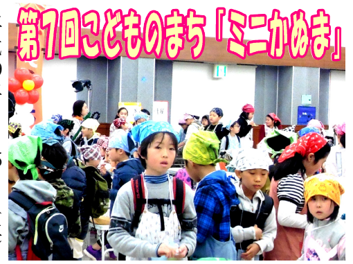
第7回こどものまち「ミニかぬま」

平成29年3月25日(土) 27日(月)に「第7回こどものまち キセキを起こせ ミニかぬま」(こども のまちミニかぬま実行委員 会主催)が鹿沼商工会議所 アザレアホールにて行われ ました。 ミニかぬまとは、子ども 達が市民となってお店を開 いたり、アルバイトをして もらえるお給料(ベリイ) を使って買い物をしたり遊 んだりできる社会体験型の イベントです。 今回の市民登録者数は5 40名、総来場者数はのべ 1290名と昨年を上回る 大盛況となりました。「い