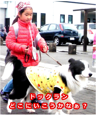
ドックラン どこにいきこうかなあ？

平成29年3月25日(土) 27日(月)に「第7回こどものまち キセキを起こせ ミニかぬま」(こども のまちミニかぬま実行委員 会主催)が鹿沼商工会議所 アザレアホールにて行われ ました。 ミニかぬまとは、子ども 達が市民となってお店を開 いたり、アルバイトをして もらえるお給料(ベリイ) を使って買い物をしたり遊 んだりできる社会体験型の イベントです。 今回の市民登録者数は5 40名、総来場者数はのべ 1290名と昨年を上回る 大盛況となりました。「い