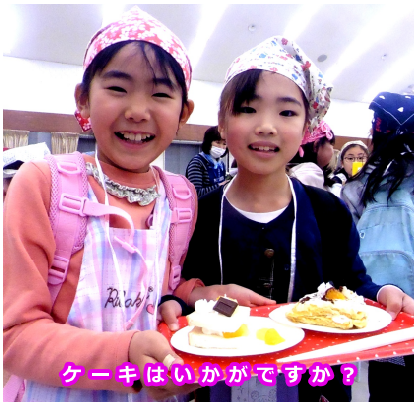
ケーキはいかがですか？