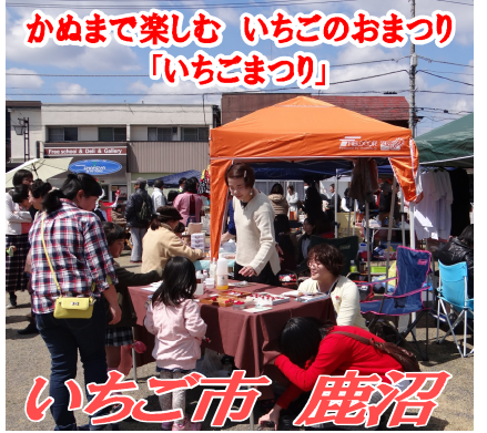
かぬまで楽しむ いちごのおまつり 「いちごまつり」