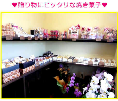
♥贈り物にピッタリな焼き菓子♥

【営】9:30~19:30 【休】不定休 【住】鹿沼市下田町1-1030 【☎】0289-77-7171