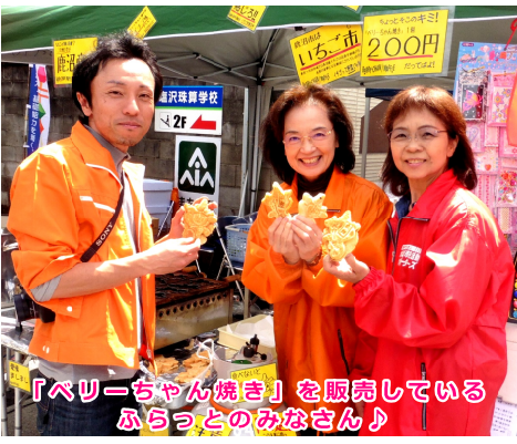
「ベリーちゃん焼き」を販売しているふらっとのみなさん♪