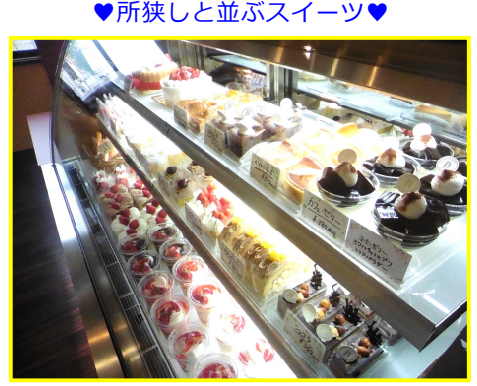
♥所狭しと並ぶスイーツ♥