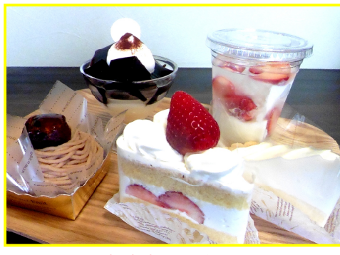
♥おすすめスイーツ♥