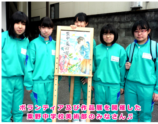
ボランティア及び作品展を開催した栗野中学校美術部のみなさん♪