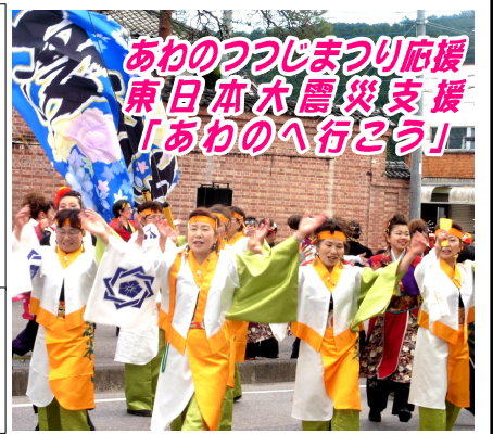
あわのつつじまつり応援 東日本大震災支援 「あわのへ行こう」