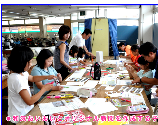
和気あいあいとオリジナル新聞を作成する子ども達

プに分れて「わくわく記者 新聞」と「なかよし新聞」 を作成しました。参加した 子ども達からは「疲れたけ ど仲間と一緒に新聞を作っ て楽しかった」、「写真を 撮る事とメモを取る事をどっ ちも同時にやる事は難しかっ た」、「とても楽しかった。 来年もやりたい」等の声が ありました。 今後開催していきたい と思いますのでご愛顧の程、 よろしく願います♪