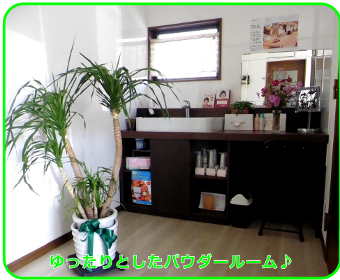
ゆったりとしたパウダールーム♪