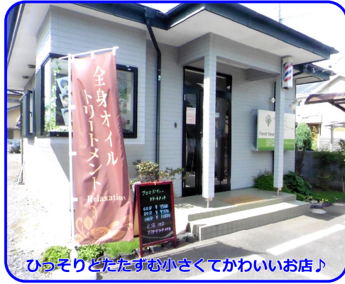
ひっそりとたたずむ小さくてかわいいお店♪

【営】9:00~20:00 (月曜日~土曜日) 9:00~19:00 (日曜日・祝祭日) 【休】水曜日 【住】壬生町安塚1997-1 【☎】0282-21-8489