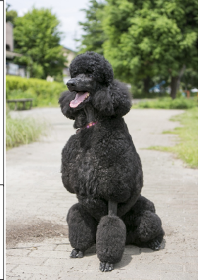
ピノちゃん( )7才 スタンダードプードル