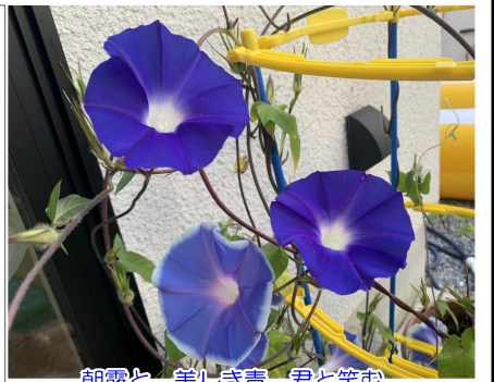
朝露と 美しき青 君と笑む 平和を願い 良き年もがな

(株)瀬谷新聞店 せやTOWN編集室 〒322-0036 鹿沼市下田町1-1021-20 TEL: 60-2855 FAX: 64-7255 URL: http://www.seyashinbun.com/