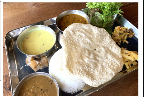
aanajaana (アーナジャーナ)・南印料理 鹿沼市西沢町337-1 / 月～金11:00-14:00