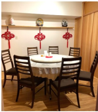
▲2名様から利用できる個室は全4室。密を避け、ゆったりと安心してお食事を楽しんでいただけます。

katei.therestaurant.jp もしくは、インスタグラム @chukakatei で検索してください