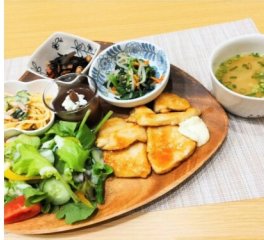
▲大人プレートランチの一例。子ども食堂は予約制。未就学児無料、学生300円、保護者・一般は500円で利用できます。

鹿沼市栄町1-33-7 080-1693-3101 【ランチ・カフェ】月・水・金 11:00~16:30 【子ども食堂※要予約】火・木 16:30~19:30