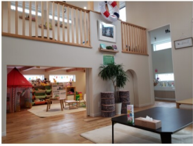
▲秘密基地の全貌。8月21日(日)は、子供も大人も楽しめる「夏祭り」を実施予定。インスタグラムにて詳細をご確認ください。

鹿沼に「秘密基地」が存在するという噂を聞きつけて向かったのが栄町にある「コミュニティカフェ3 SMILE(スリースマイル)」。