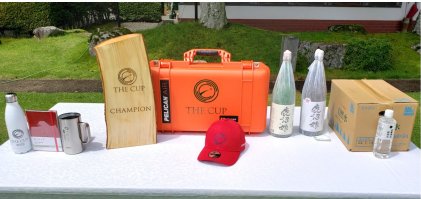
写真④東京オリンピックで実際に着用した選手団の制服などが展示された。写真⑤賞品は、地元鹿沼にちなんだ物が並ぶ。写真⑥中でもトロフィーは山の木を切るこだわり。熊の爪の跡もあえて残してある。