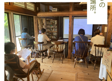
もう一つのあなたの居場所。

まず当事者の方向けには、予約不要で立ち寄れる居場所が利用できます。ゲームや読書、おしゃべりなど何かをしてもしなくてもよいカフェのような空間です。公認心理師や心理カウンセラーによるカウンセリングを受けることもできます。ご家族向けにはひきこもり専門の家族相談、当事者の