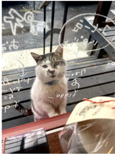
「今日は僕起きてるニヤン」

食品を販売する企画など計画しています。 『ネコヤ菓子店』には「カット」という看板猫ちゃんがお店の前にいて、いつもは寝ているカットですが気分が来るとお客様をお出迎える時もある癒し猫がいます。なかなか起きてくれないので、出会えたらラッキーかも知れませんが！ 大切な人への贈り物にも、自分で使うためのアイテムもたくさん揃っているののでぜひ『ネコヤ菓子店』でカワイイをゲットしてみてください！