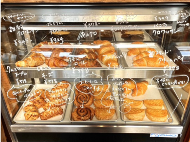
珈琲との相性抜群のバターが香る美味しいパンのラインナップ♪ バターの香る食欲をそそる

鹿沼市上材木町1741-2 ☎ 0289-60-1610 定休日 月曜日 第1・3火曜日 (祝日営業の場合は翌日休み) 営業時間 11:00 - 17:00 駐車場 12台可