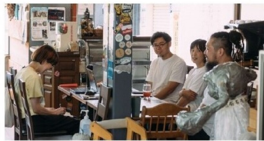
▲インタビュー風景。顔を合わせて話すことを大切に

昨今はSNSの普及により、簡単に個人の声を発信できるようになりました。しかしながらその便利さや手軽さ、匿名性によって攻撃的になったり、それで傷つく人が